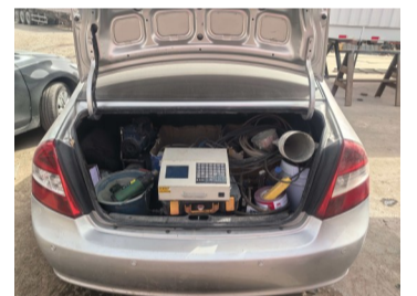
民警查获的制假设备。