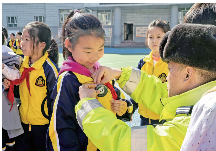
3月30日,在乌鲁木齐市第8小学,乌鲁木齐市水磨沟区分局交警支队民警给在活动中表现优异的学生佩戴“交警徽章”。

乌鲁木齐市水磨沟区分局交警支队沙依巴克区大队、米东区大队民警来到辖区学校户外场地,以校车、警车为教具,向学生们讲解车辆视野盲区、“鬼探头”等高风险交通情境,提醒学生上下学途中远离危险区域,不在大型车辆周边玩耍、逗