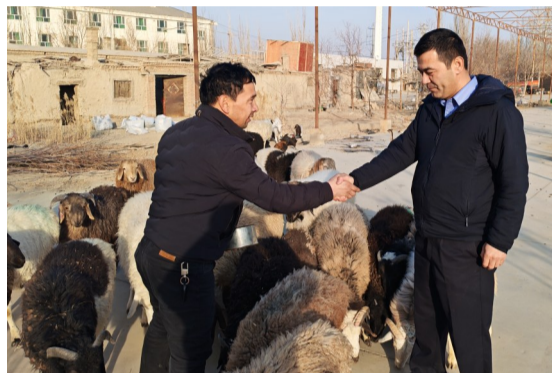
1月15日,库尔勒市公安局民警向群众返还部分被盗羊只。